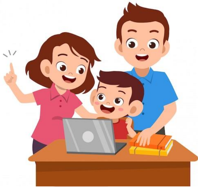
PADRES/ACUDIENES Y EDUCANDOS